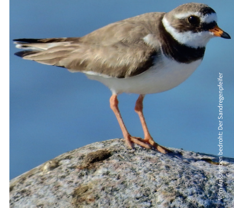
Vorn-Ausstreifen bedruckt: Der Sandregenpfeifer