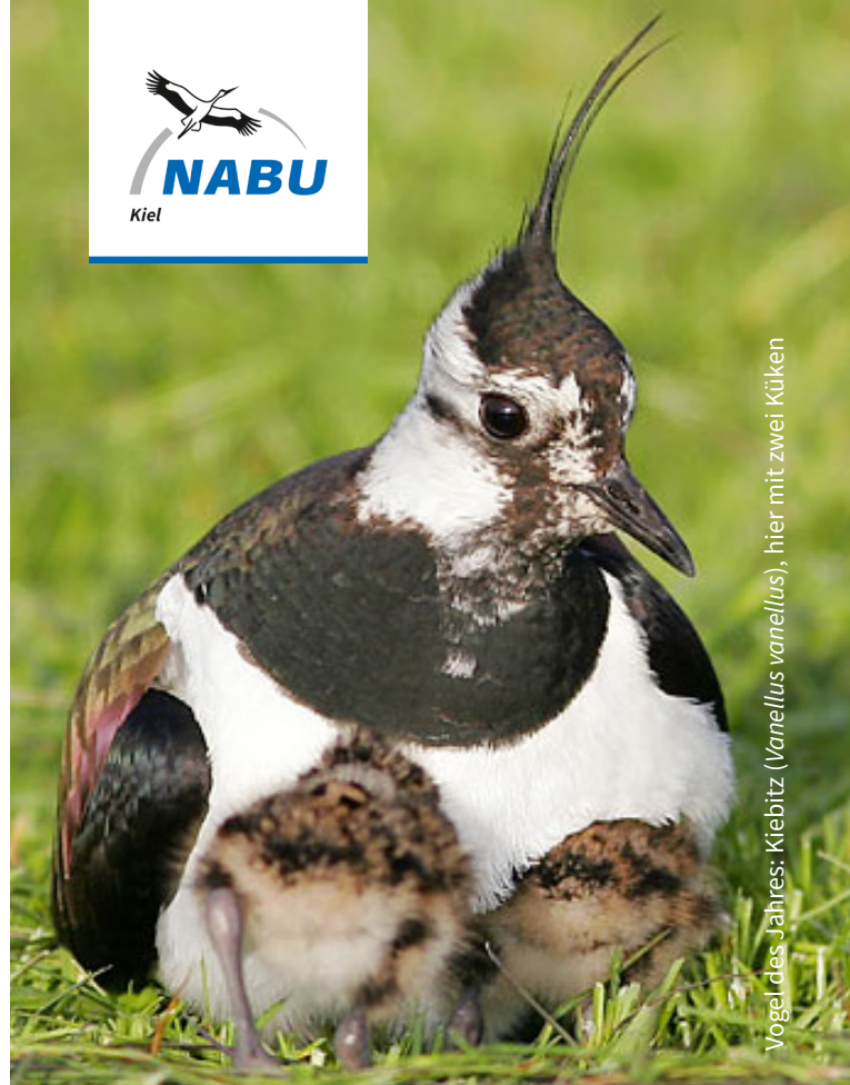
Vogel des Jahres: Kiebitz (Vanellus vanellus), hier mit zwei Küken